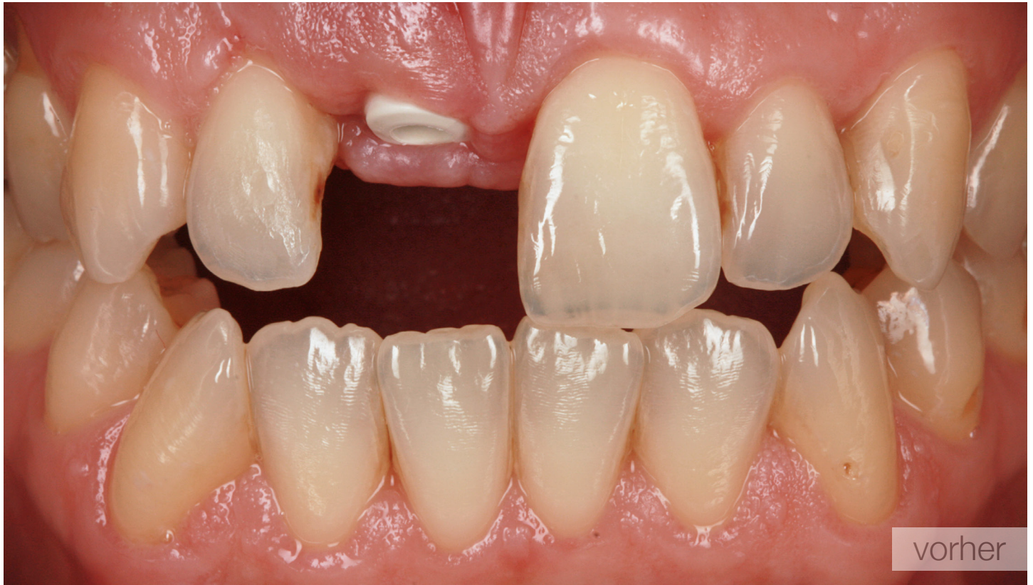
implantat 11 (Izp zur Ausformung des Emergenzprofils)